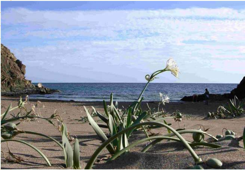
Playa del Baño de Las Mujeres Litoral de Lorca