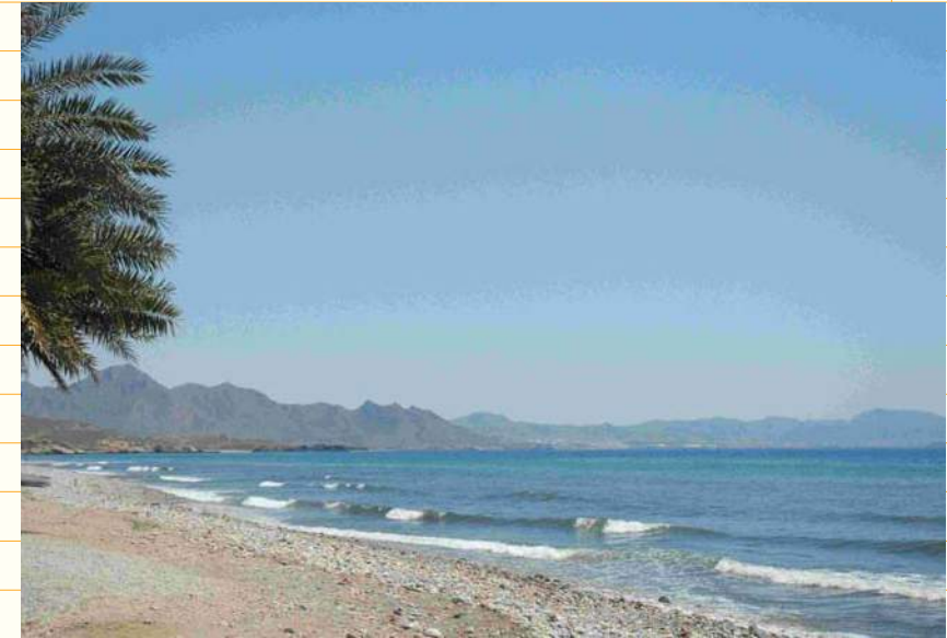
Playa de Puntas de Calnegre Litoral de Lorca