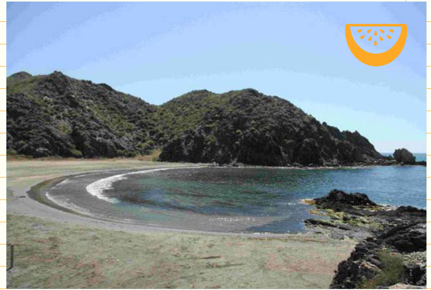
Playa del Siscal Litoral de Lorca