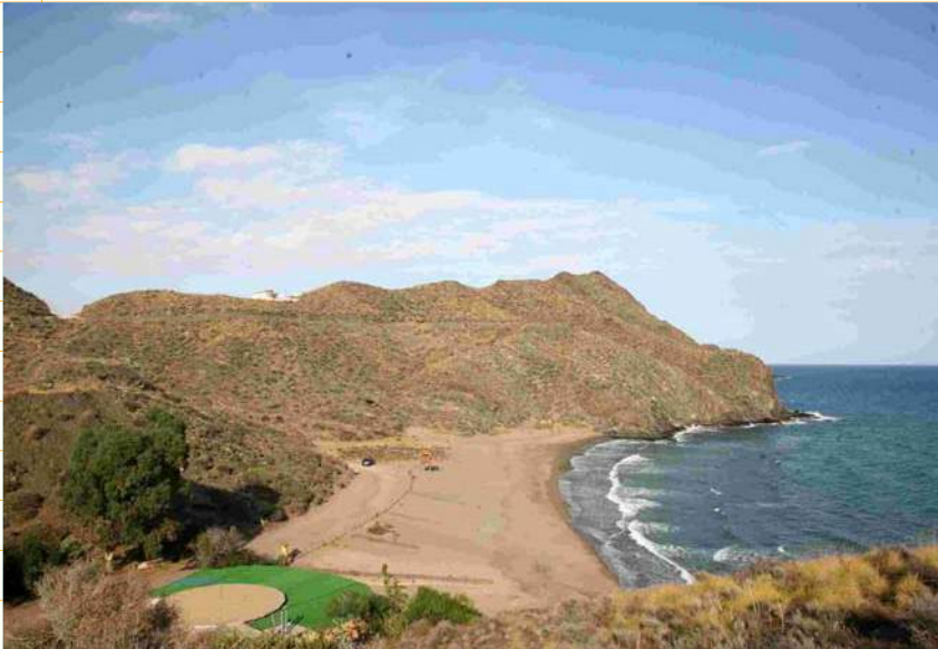
Playa de Calnegre Litoral de Lorca