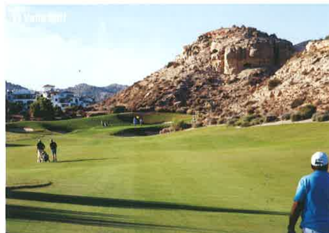
El Valle Golf