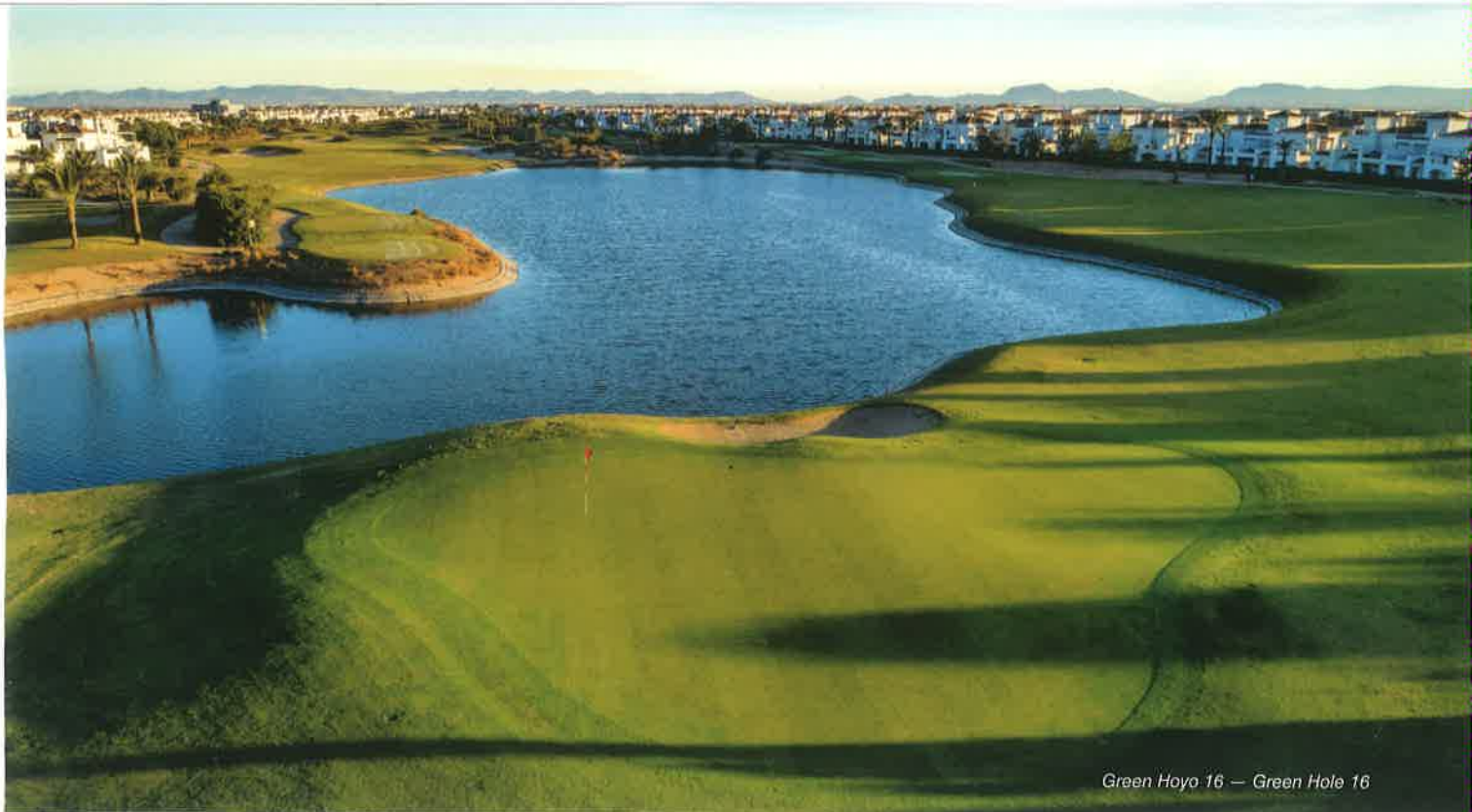
Green Hoyo 16 — Green Hole 16