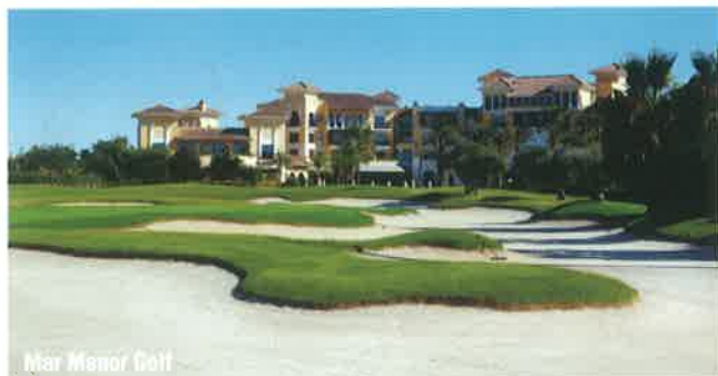
Mar Menor Golf

GNK Golf offers a range of 6 golf courses: Golf Mar Menor, La Torre Golf, Golf Saurines, Hacienda Riquelme Golf, El Valle Golf and Alhama Signature, all designed by the famous Jack Nicklaus. Probably the greatest golf destination in Europe.