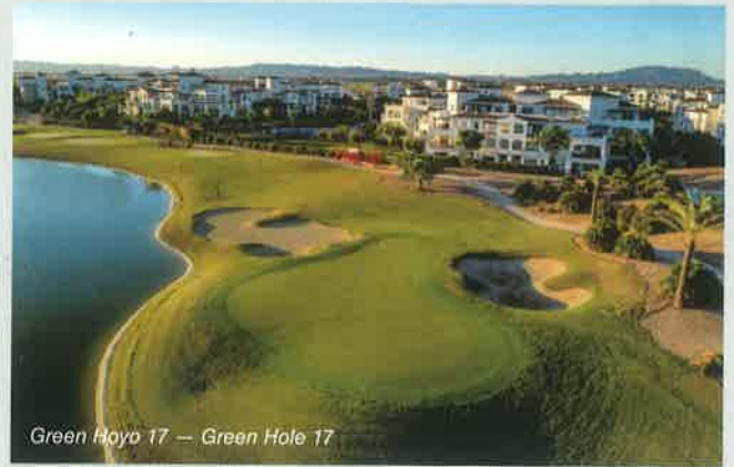
Green Hoyo 17 — Green Hole 17