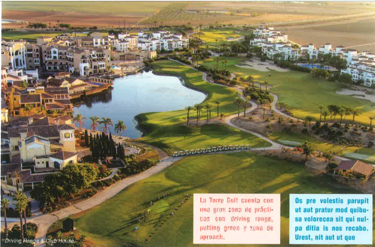
Driving Range & Club House

La Torre Golf cuenta con una gran zona de prácticas con driving range, putting green y zona de approach.