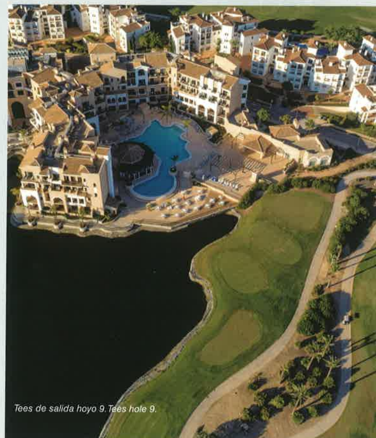
Tees de salida hoyo 9. Tees hole 9.