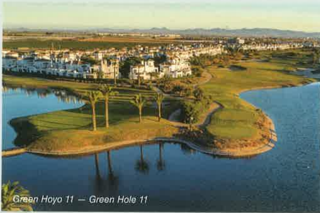
Green Hoyo 11 — Green Hole 11