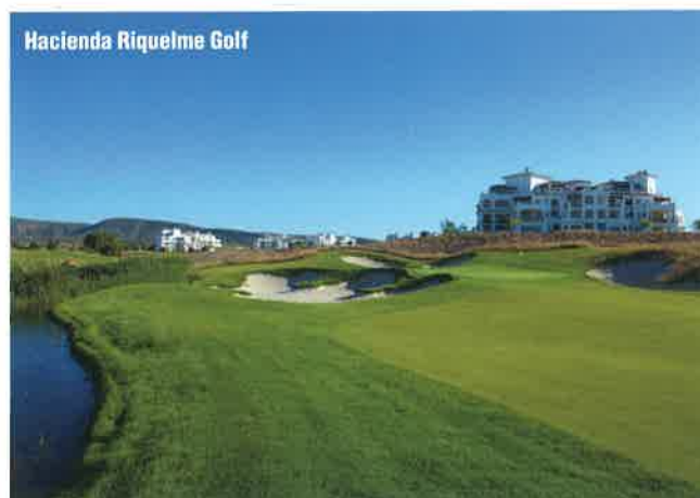
Hacienda Riquelme Golf

ALHAMA SIGNATURE Par 72, 6,884 metros. An exceptional course, designed and signed personally by Jack Nicklaus. This long and spectacular course has been developed among five great lakes. Wide fairways with fast greens, 116 bunkers of particular and varied shapes. This is the course that appears on our cover photo in this issue.