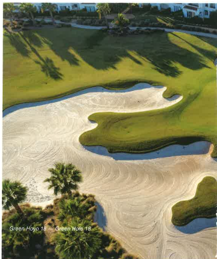
Green Hoyo 18 — Green Hole 18

La Torre Golf is located 25 kms from the centre of Murcia and 25 kms from San Javier Airport. This 5 star resort is considered one of the most important in the Region of Murcia. However in this article we want to focus on the golf course that bears the same name La Torre Golf. A course with consistent and fast greens, surrounded by bunkers and strategically located lakes. Greens that reject the ball if it has not been struck with precision, its turtle shell shapes make the ball roll to obstacles. Without a doubt, an ideal course for a strategic game, exciting and precise. All holes have a choice of five tees which makes it much more fun depending on the level of each player.